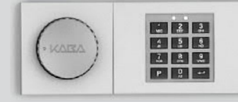
Elektronisches Kombinationsschloss - B 30