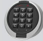
Elektronisches Kombinationsschloss - Primor 3000 level 5