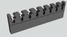
Waffenhalter aus Schaumstoff selbstklebend, lose (für 8 KW) + Teppich aus Schaumstoff