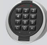
Elektronisches Kombinationsschloss - Primor 3000 level 15