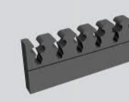
Waffenhalter aus Schaumstoff selbstklebend, lose (für 6 KW) + Teppich aus Schaumstoff