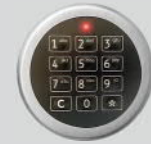
Elektronisches Kombinationsschloss - Solar Business