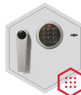
Elektronischeschloss kombiniert mit mechanischer Revision