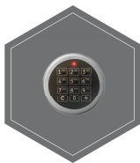
Elektronischeschloss mit 2 Tastaturen (innen und aussen)