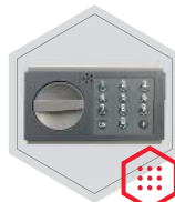
Elektronisches Kombinationsschloss (außer Art. 17000-17001)