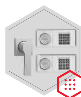
Elektronisches Kombinationsschloss B 90