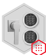
Elektronisches Kombinationsschloss Stellar Basic