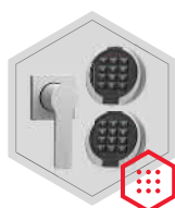
Elektronisches Kombinationsschloss Primor 3000 level 5