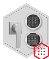
Elektronisches Kombinationsschloss Stellar Business