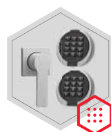
Elektronisches Kombinationsschloss Primor 3000 level 15